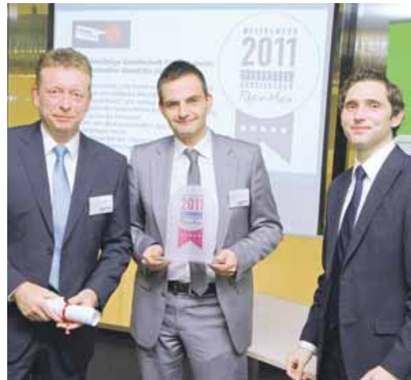
Dienstleistung mit und für Menschen: Die Gemeinnützige Gesellschaft für ambulante und stationäre Altenhilfe (GFA) mbH.