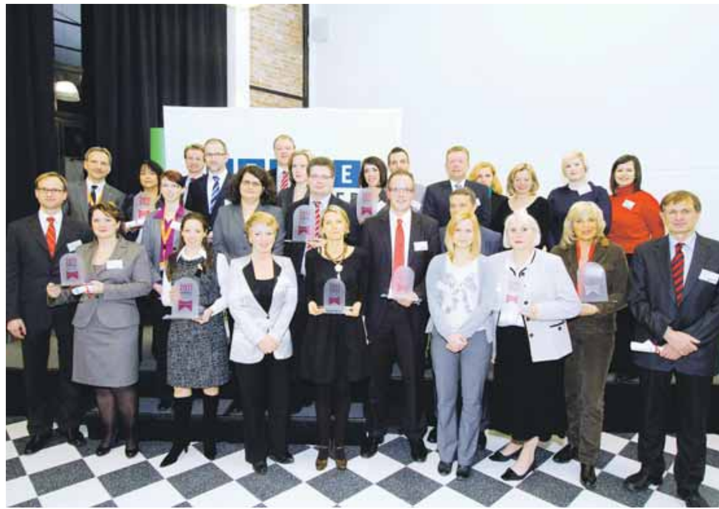
Die besten Arbeitgeber des Wettbewerbs 2011 wurden im Februar im Rahmen einer feierlichen Preisverleihung gekürt.

Um sich von der regionalen Konkurrenz zu differenzieren, empfiehlt es sich, Vorteile wie eine mitarbeiterfreundliche Unternehmenskultur in den Vordergrund zu stellen. Dabei können Arbeitgeberwettbewerbe erfolgversprechend sein. Fast 45 Prozent der Befragten im Rhein-Main-Gebiet orientieren