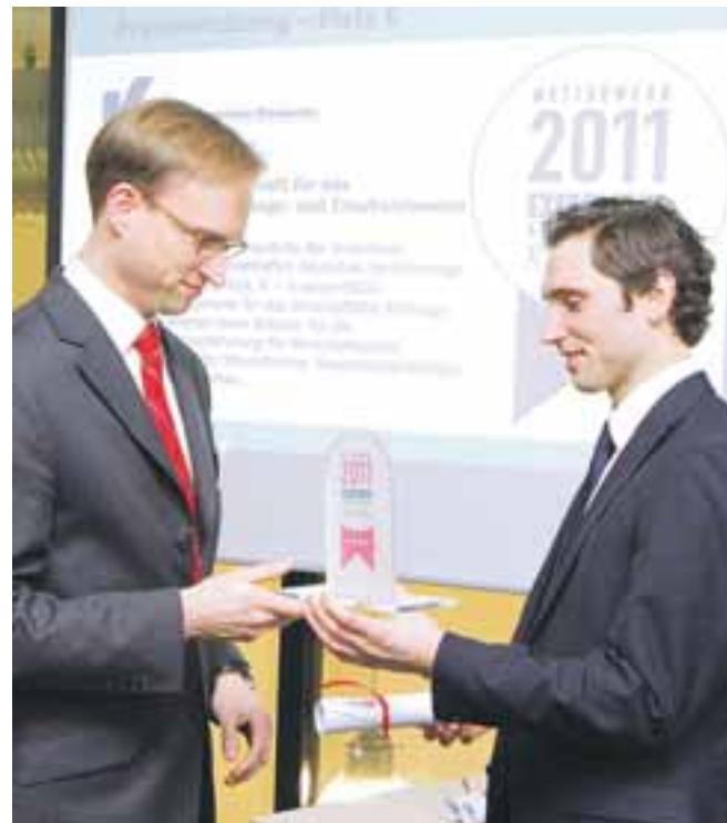
Ausgezeichneter Arbeitgeber: Die Versicherungsgemeinschaft für das wirtschaftliche Prüfungs- und Treuhandwesen.