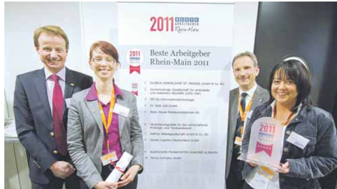
Ein Unternehmen mit Vorbildfunktion: Die Globus „Beste Arbeitgeber Rhein-Main 2011“ kam die Gruppe beschäftigt derzeit rund 31 000 Mitarbeiter im In- und Ausland. Beim Wettbewerb Firma auf den 1. Platz.